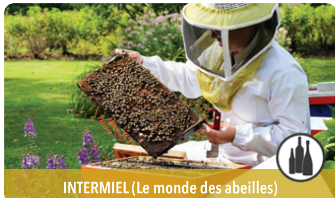
INTERMIEL (Le monde des abeilles)

8871, rang Saint-Vincent, Mirabel, J7N 2W5 450 258-3412 | boucanneriebellerivière.com f