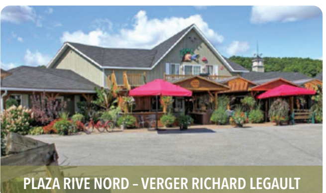
PLAZA RIVE NORD - VERGER RICHARD LEGAULT

649, chemin Principal, Saint-Joseph-du-Lac, J0N 1M0 t 450 623-4888 | cidrierielacroix.com f