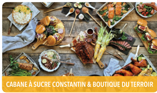
CABANE À SUCRE CONSTANTIN & BOUTIQUE DU TERROIR

807, chemin de la Rivière Nord, Saint-Eustache, J7R 0J5 t 450 491-3997 | vignobleriviereduchene.ca f