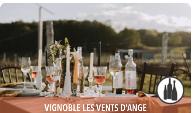
VIGNOBLE LES VENTS D'ANGE

854, chemin Principal, Saint-Joseph-du-Lac, J0N 1M0 t 450 623-4889 f