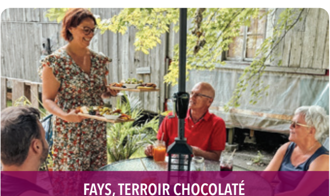
FAYS, TERROIR CHOCOLATÉ

2020, chemin d'Oka, Oka, J0N 1E0 t 450 479-8365 | sepaq.com/pq/oka f