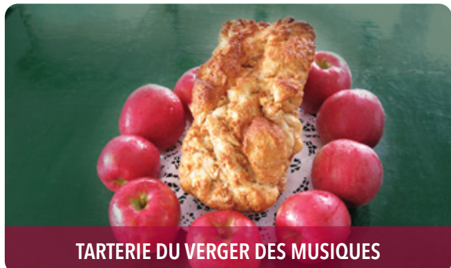
TARTERIE DU VERGER DES MUSIQUES

1473, chemin Principal, Saint-Joseph-du-Lac, J0N 1M0 t 450 491-7859 | domainelafrance.com f