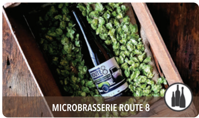
MICROBRASSERIE ROUTE 8

1054, boul. Arthur-Sauvé, Saint-Eustache, J7R 4K3 t 450 473-2374, 1 800 363-2464 constantin.ca | produitsdantan.com f