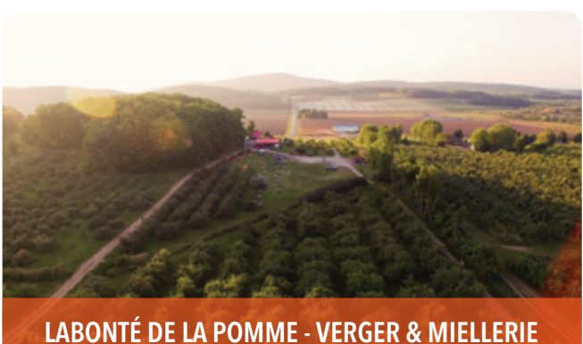
LABONTÉ DE LA POMME - VERGER & MIELLERIE

190, rue des Angles - Quai municipal, Oka, J0N 1E0 438 444-4419 | traverseoka.ca f