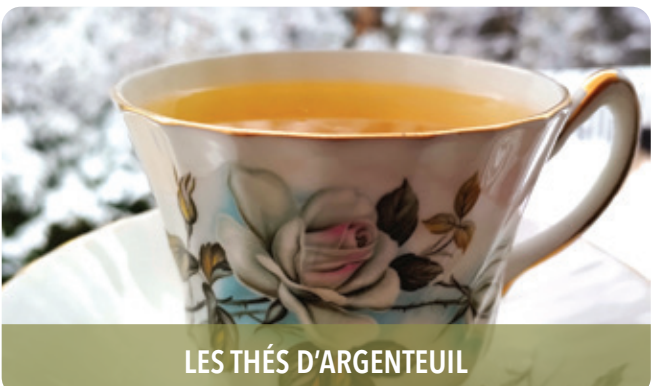
LES THÉS D'ARGENTEUIL

405, rang de l'Annonciation, Oka, J0N 1E0 t 450 479-1111 | labontedelapomme.ca f