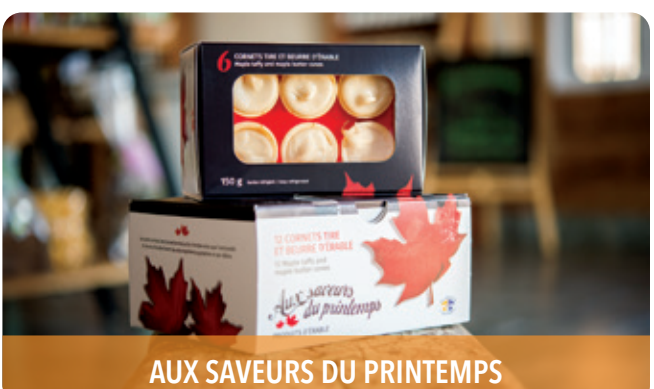
AUX SAVEURS DU PRINTEMPS

12465, côte des Saints, Mirabel, J7N 2W1 1 888 880-0401 | cotedessaints.com f