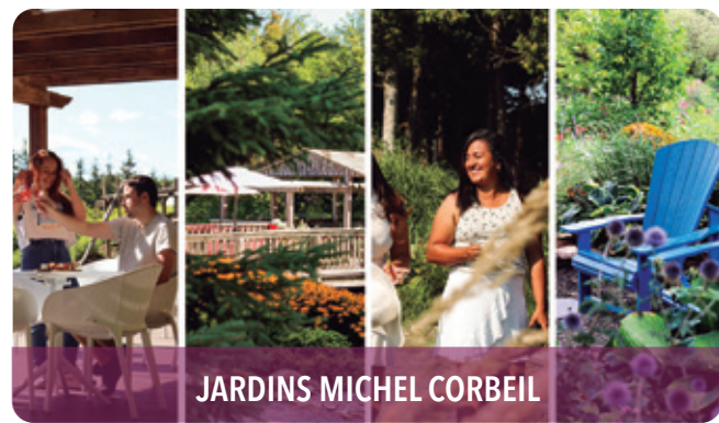
JARDINS MICHEL CORBEIL

1054, boul. Arthur-Sauvé, Saint-Eustache, J7R 4K3 t 450 473-2374 route8.ca | produitsdantan.com f