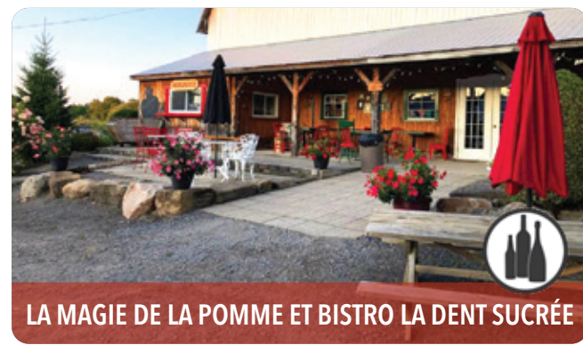
LA MAGIE DE LA POMME ET BISTRO LA DENT SUCRÉE

961, boul. Arthur-Sauvé, Saint-Eustache, J7R 4K3 t 450 472-4358 | jardinsmichelcorbeil.com f i