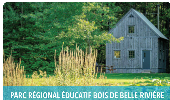
PARC RÉGIONAL ÉDUCATIF BOIS DE BELLE-RIVIÈRE

925, chemin Fresnière, Saint-Eustache, J7R 0G3 t 450 623-0062 | lamagiedelapomme.com f bistoladentsucree.ca