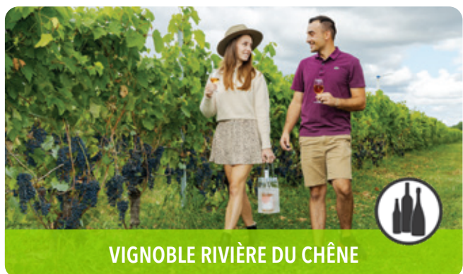
VIGNOBLE RIVIÈRE DU CHÊNE

232, rue Saint-Eustache, Saint-Eustache, J7R 2L7 t 450 974-5170 | vieuxsainteustache.com f