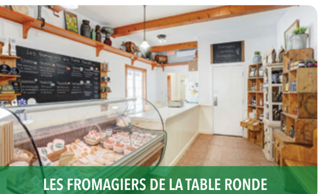
LES FROMAGIERS DE LA TABLE RONDE

248, rue Godmer, Saint-Jérôme, J7Z 5H5 t 450 436-3438 | dieuduciel.com f i