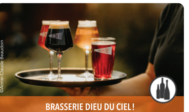
BRASSERIE DIEU DU CIEL!

150, boulevard Lachapelle, Saint-Jérôme, J7Z 7L2 450 438-5822 f