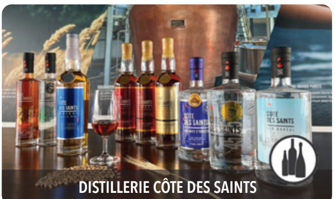
DISTILLERIE CÔTE DES SAINTS

11730, route Sir-Wilfrid-Laurier, Mirabel, J7N 1P5 450 432-2629, poste 1 | serresleciel.com f i